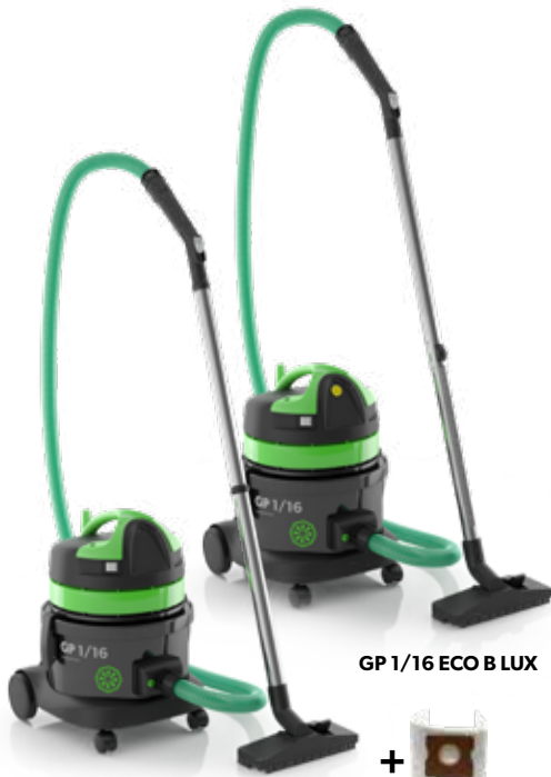
GP 1/16 ECO B